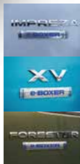
■ Три моделі: гібридна система e-BOXER доступна на моделях XV, Impreza та Forester

При руханні з місця та русі з низькою швидкістю система e-BOXER задіє електромотор, що забезпечує безшумну їзду з нульовим рівнем шкідливих викидів. Залежно від ступеня зарядки аку-