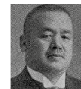
■ Чікухей Накаджіма: засновник компанії Aircraft Research Laboratory, попередниці Subaru

У подальшому Subaru розширять модельний ряд з акцентом на сегмент SUV&XUV, де бренд вже багато років поспіль займає лідерські позиції. Наші значні компетенції, багаторічний досвід та нескінченна наснага допомагають створювати найкращі автомобілі для поціновувачів активного способу життя.